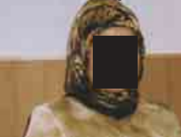
Gelinin kocası ile kaçan C.M.

Not: İsimler verilmemiştir. Baş harfler değiştirilmiştir.