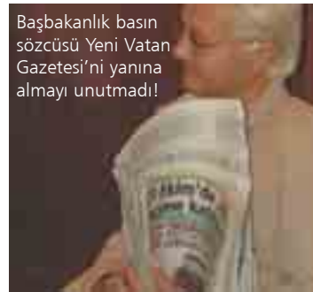
Başbakanlık basın sözcüsü Yeni Vatan Gazetesi'ni yanına almayı unutmadı!

yükü de düşünmek gerektiğini belirten Schüssel, kendilerinden başka hiçbir ülkenin bunun nasilını düşünmediğini ifade ettikten sonra, "Avusturya'da yaşayan Türkiye'den göç etmiş insanlar ile gurur duyuyorum, onların Avusturya'ya yararlarını biliyorum ve bunu her tarafta duyuyorum. Minnetlerimi sunarım. Avusturya'da nereye gitsem onların çalışkanlıklarını görüyorum. El, ele gönül, gönül verip güzel birlikte günlere gidelim " dedi.