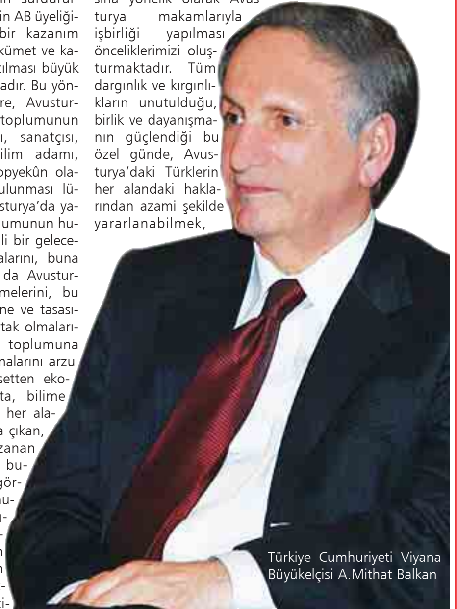
Türkiye Cumhuriyeti Viyana Büyükelçisi A.Mithat Balkan

sorunlarına çözüm bulabilmek için birlik ve dayanışma içinde olmalarının önemini de vurgulamak istiyorum. Bu duygu ve düşüncelerle hepimizin Ramazan Bayramı'nı en iyi dileklerle kutluyor, bayram günlerini aileleriniz ve yakınlarınızla huzur ve mutluluk içinde geçirmenizi diliyorum.