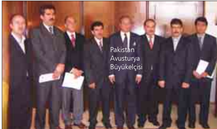
Pakistan Avusturya Büyükelçisi